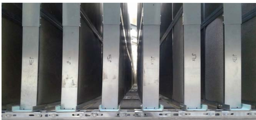
Setti afonici SA/LF Tipo di applicazione su orditura metallica predisposta sopra una costruzione in cemento armato