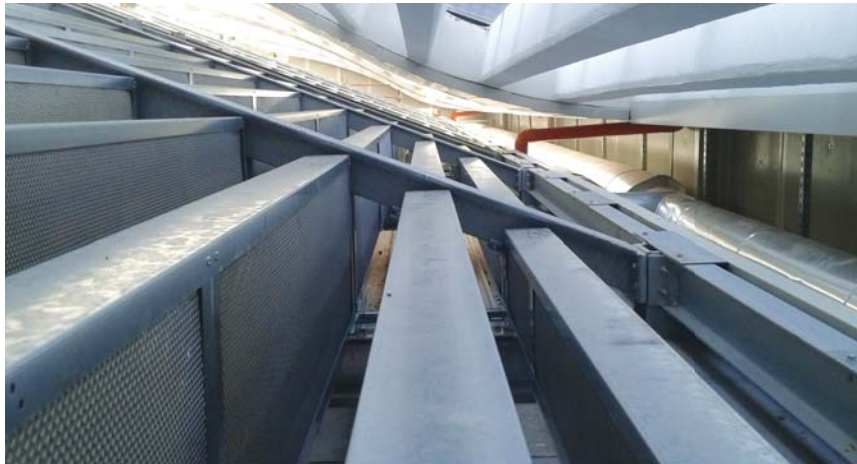
Setti afonici SA/LF Tipo di applicazione su struttura metallica di un edificio per impianti tecnologici